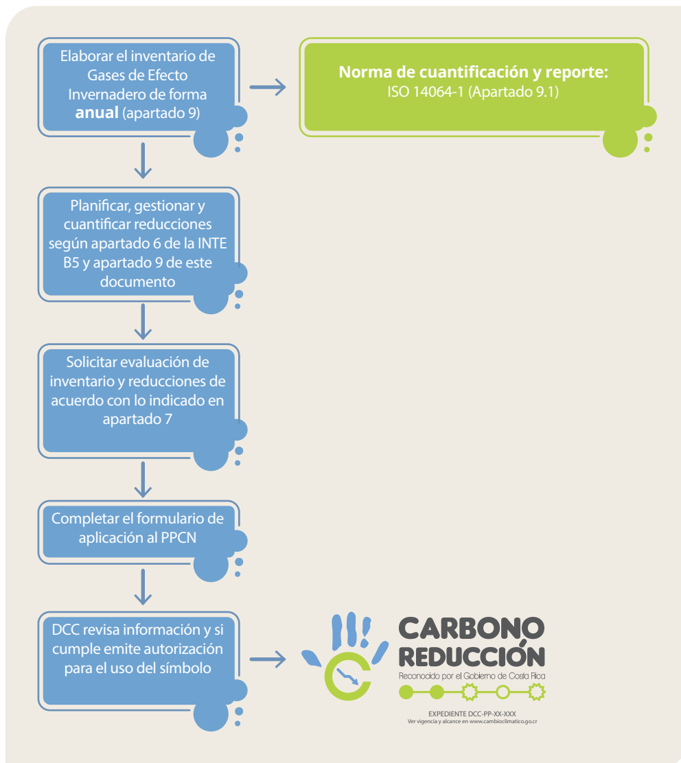
Figura 3. Proceso para obtener el reconocimiento de Carbono Reducción

La siguiente figura resume el proceso anteriormente descrito: