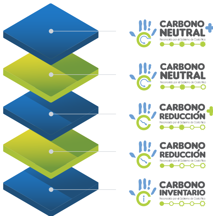
Figura 1. Estructura del Sistema de Reconocimiento del PPCN 2.0

La Figura 1 muestra la estructura del sistema de reconocimiento del PPCN 2.0. Las condiciones establecidas en las categorías deben ser verificadas por el Organismo de Validación y Verificación (OVV) de acuerdo a los requisitos establecidos en la Parte II de este documento, quien, a su vez, debe emitir una recomendación a la DCC, basada en evidencias objetivas, siendo la DCC la única responsable de la decisión final en la entrega de todos los certificados emitidos por el MINAE, así como del otorgamiento del permiso del uso de los símbolos oficiales del Gobierno.