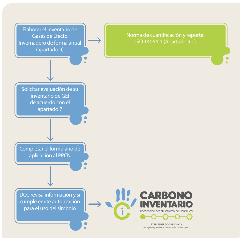
Figura 2. Proceso para obtener el reconocimiento de Carbono Inventario

La siguiente figura resume el proceso anteriormente descrito: