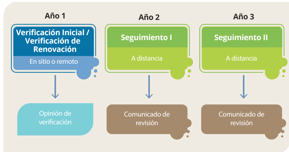
Figura 7. Ciclo de evaluación a aplicar por parte del OVV para el aseguramiento de requisitos de centros educativos.

El proceso anteriormente descrito se puede visualizar a continuación en la figura 7: