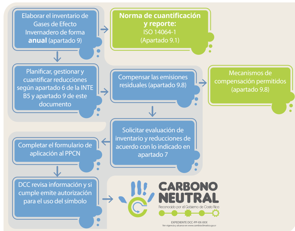
Figura 5. Proceso para obtener el reconocimiento de Carbono Neutral.

La siguiente figura resume el proceso anteriormente descrito: